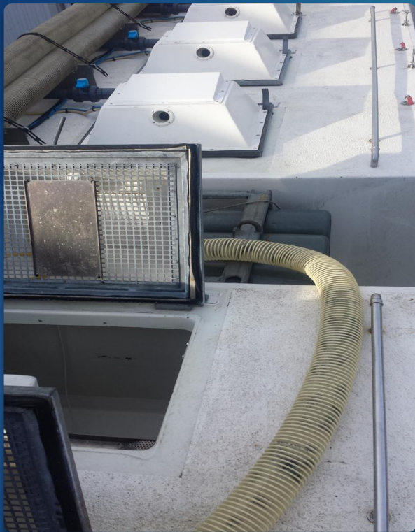
Norsk oppdrettsservice Flekkefjord