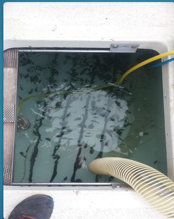
Fungere fint med pumping