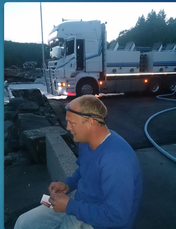
Pause trenger man ;-)